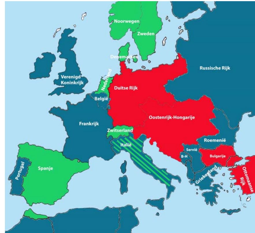
Opmerking: Italië is hier in blauw-groen voorgesteld, omdat het land in 1914 neutraal was, maar zich in mei 1915 aansloot bij de Geallieerden.